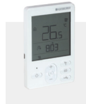
↑ Der Raumthermostat RCD2 bietet verschiedene Komfortfunktionen.

Das modular aufgebaute Steuersystem von Geberit ist für die Regelung und die Kontrolle moderner Bodenheizungen und Kühlanwendungen in Wohn- und Geschäftsräumen konzipiert. Das System bietet ein Maximum an Bedienkomfort und kann jederzeit erweitert werden.