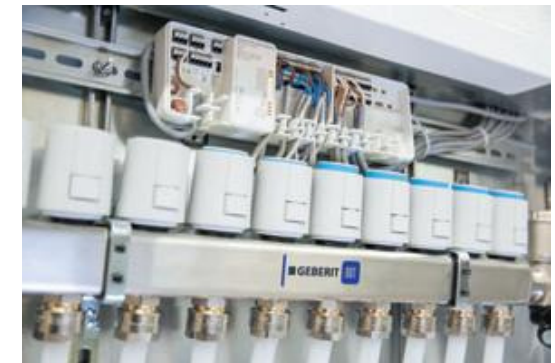
↑ Die zentrale Reglereinheit kann bis zu sechs Temperaturzonen regeln.

Mit dem Steuersystem bietet Geberit erstmals komplette Lösungen für die Flächentemperierung in Gebäuden an. Das umfassende Sortiment an Komponenten für die Regelung und die Kontrolle der Heiz- oder Kühlkreisläufe ist vollständig kompatibel zum Rohrleitungssystem Geberit Volex.